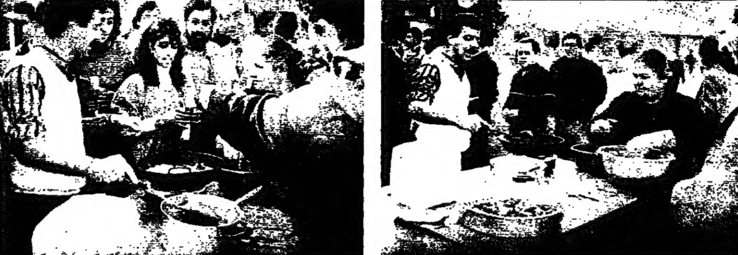
المسيرة في الكسليك